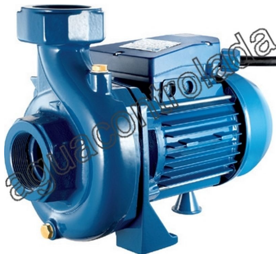
Bomba superficie centrifuga Gran Caudal 0,8 c.v.230 v Monf.