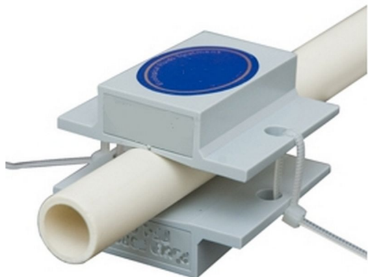
Acondicionador Magnético Combustión Calderas Gas Neodimio