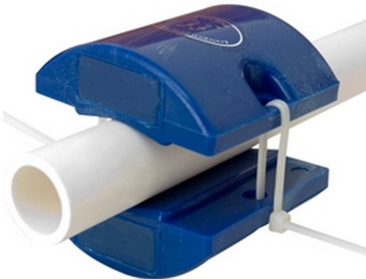
Descalcificador Antical Magnético Jardines y Huertos Neodimio